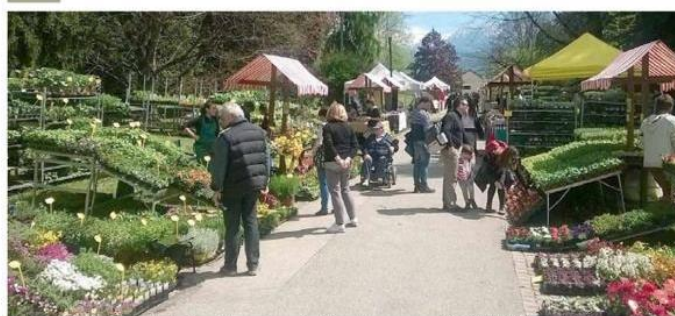
Ortignano, dal 23 al 26 aprile a Levico Terme, è la prossima manifestazione del programma eventi 2020 dell'Apt Valsugana Lagorai