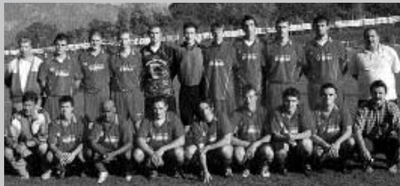
La formazione Juniores dell'U.S. Borgo laureatasi Campione Provinciale di categoria per la stagione 2003/2004

S i è conclusa alla metà di giugno la lunga stagione calcistica 2003/2004, culminata con il doppio spareggio di Mezzolombardo che ha visto protagonista la prima squadra: il primo, vinto 1-0 contro la Baone, decretava la seconda classificata nel girone trentino di Promozione, il secondo,